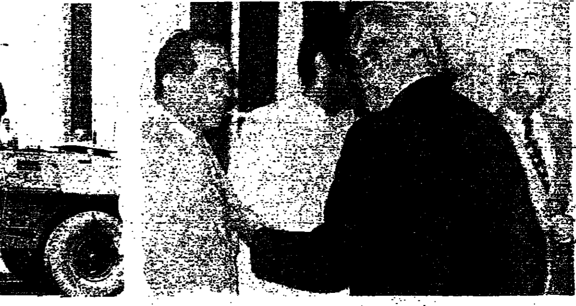
الرئيس شمعون يتحدث الى المجلس ايس ، ويبدو الرئيس كرايمى مخضبة ترائب امام مجلس النواب قبل الجلسة امين

بمجلسه على الرئيس كرايمى انتفاع الناس بان اجتمع المجلس النيابي لانتخاب رئيس له هو اكبر انتصار للديمقراطية والحوار . هذا الانتصار اليائس يلق بصدقه الديموقراطية البائسة . والرئيس كرايمى سيد العارفين . فهو يعرف ماذا يقص من الدولة ويسن الاستقلال ومن الديموقراطية . وهو يعرف ان اكبر انتصار هو وقف الحرب ولا شيء قبل ذلك . والبعض يقول ، ان رئيس الحكومة تعلم هكذا انه يعرف اكثر من اللام . اي انه تحدث عن الكفة لتسبح الجارة . فهو يريد التأكيد على وجود المؤسسات الدستورية لقطع الطريق على ما يجري التخطيط له او التفكير فيه . على الضفة الثانية من الدولة . وقد يكون ذلك صحيحاً . الا انه لا يتم ولا يجرى . فالشريعة الوحيدة القابلة الآن هي شريعة السلاح والسلم . واصغر تقاضى او خلف يستطع ان يؤسر في مصر لبنان اكثر من المجلس النيابي . ومن المسك الهني الاعتقاد بان الديموقراطية موجودة لجرد ان الدولة من جعل القاب الرؤساء والوزراء والوزراء . ومن الخلف ان تخاف من الفراغ الدستوري والا تخاف من الحرب الاهلية التي تجري في فراغ الدولة . بل ان الحديث عن تعديل الدستور او عدم تعديله يذكى يكون حديثاً عن الفراغ . فهل نحن حقاً مكتوبون بالدستور ؟ ام ينجح المسلمون في تعليق الدستور ، بل في تعليق الحكم ؟ وإذا كان هناك تفكير في اتخاذ اجراءات استثنائية مبررة فخطن يمنع حدوث ذلك كون المجلس لا يزال قادراً على الاجتماع . وان تأتيا ككاروا ريسهم على فتح الانسلاخ خلال الاحداث فجدوا له الرئاسة . ما ينتج ذلك هو وقت الحرب والشعور بان عدم تعديله يذكى يكون حديثاً عن الفراغ . فهل نحن حقاً مكتوبون بالدستور ؟ ام ينجح المسلمون في تعليق الدستور ، بل في تعليق الحكم ؟